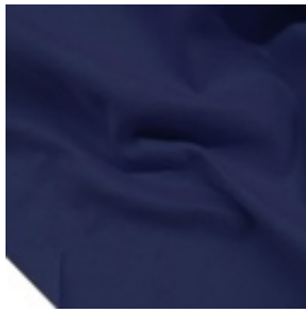
Azul Marino #100012