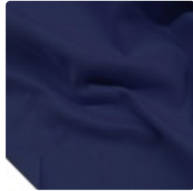
Azul Marino #0027-000012